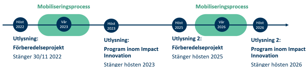
Figur 2. Bilden visualiserar processen framåt med utlysningen i höst som stänger 30/11 2022, mobiliseringsprocessen under våren 2023 och utlysningen om program inom Impact Innovation som stänger hösten 2023. Denna process planeras att genomföras ytterligare en gång, med en utlysning om förberedelseprojekt som stänger hösten 2025 och mobiliseringsprocess våren 2026 och en utlysning om program inom Impact Innovation som stänger hösten 2026.