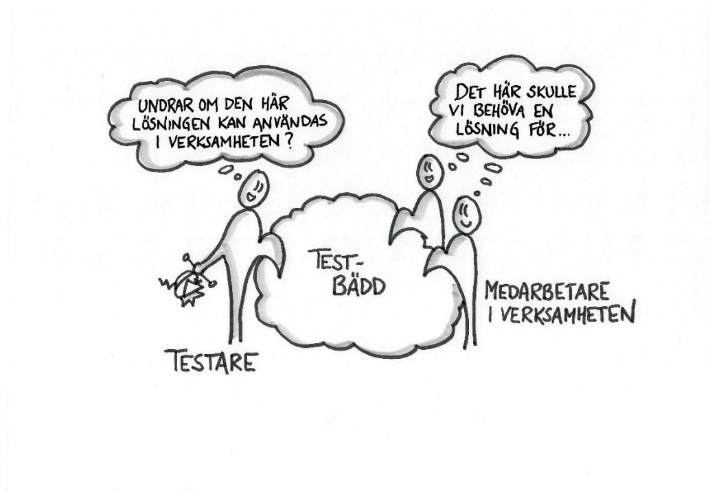
Figur 2 I en testbädd möts testare och medarbetare för att tillsammans testa och utveckla lösningar. En testbädd handlar om att löpande kunna ta emot och samarbeta med flera testare i olika test

Med ett test menar vi aktiviteter som utvärderar, verifierar och använder en lösning. Observera att ett enskilt test inte är samma sak som en testbädd.