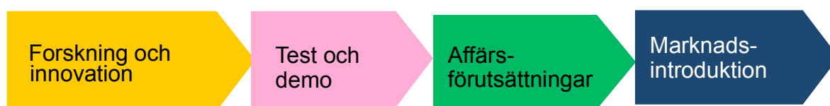
Figur 3. Övergripande skiss för de olika stegen inom FFI.

Figur 2 visar schematiskt de olika stegen i en utvecklingskedja, från idé till marknadsintroduktion, av en ny produkt eller tjänst. Dessa används i följande till exempel för att översiktligt visa under vilken tidsperiod som de olika stegen dominerar för respektive milstolpe och område.