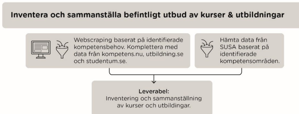
Figur 3 Schematisk beskrivning av inventering och sammanställning av utbildningsutbud.

Mer information kring insamling av underlag och data finns i analysbilaga.