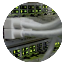
Informations- och kommunikationsteknik