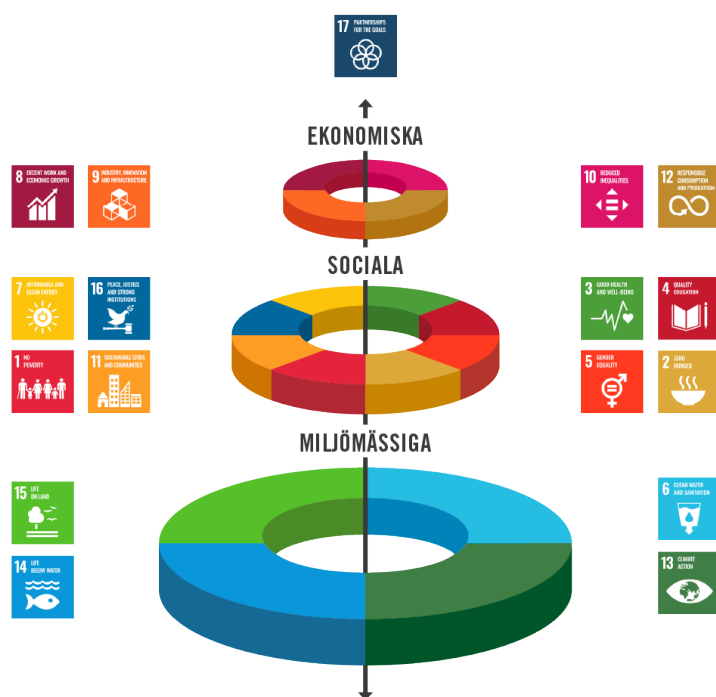
Figur 1. De Globala målen för hållbar utveckling

Det övergripande målet i regeringens digitaliseringsstrategi För ett hållbart digitaliserat Sverige , maj 2017, är att Sverige ska vara bäst i världen på att använda digitaliseringens möjligheter. Detta övergripande nationella mål är utgångspunkten för vårt förslag till strategiskt program för att möta och leda i den digitala strukturomvandlingen. Vårt förslag baseras på följande vision: Ett hållbart digitaliserat Sverige 2030 . Det förutsätter en avsevärt förbättrad nationell förmåga i Sverige att möta och leda i digital strukturomvandling för ekologisk, social och ekonomisk hållbarhet, som bidrar till att uppfylla FNs globala mål för hållbar utveckling i agenda 2030.