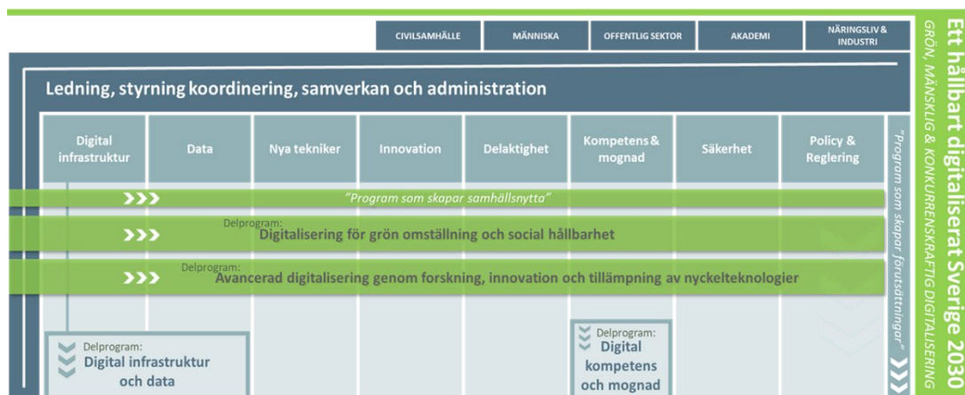
Figur 3. Centrala dimensioner och tematiker i det strategiska programmet

Det strategiska programmets olika centrala dimensioner och tematiker illustreras i figur 3.